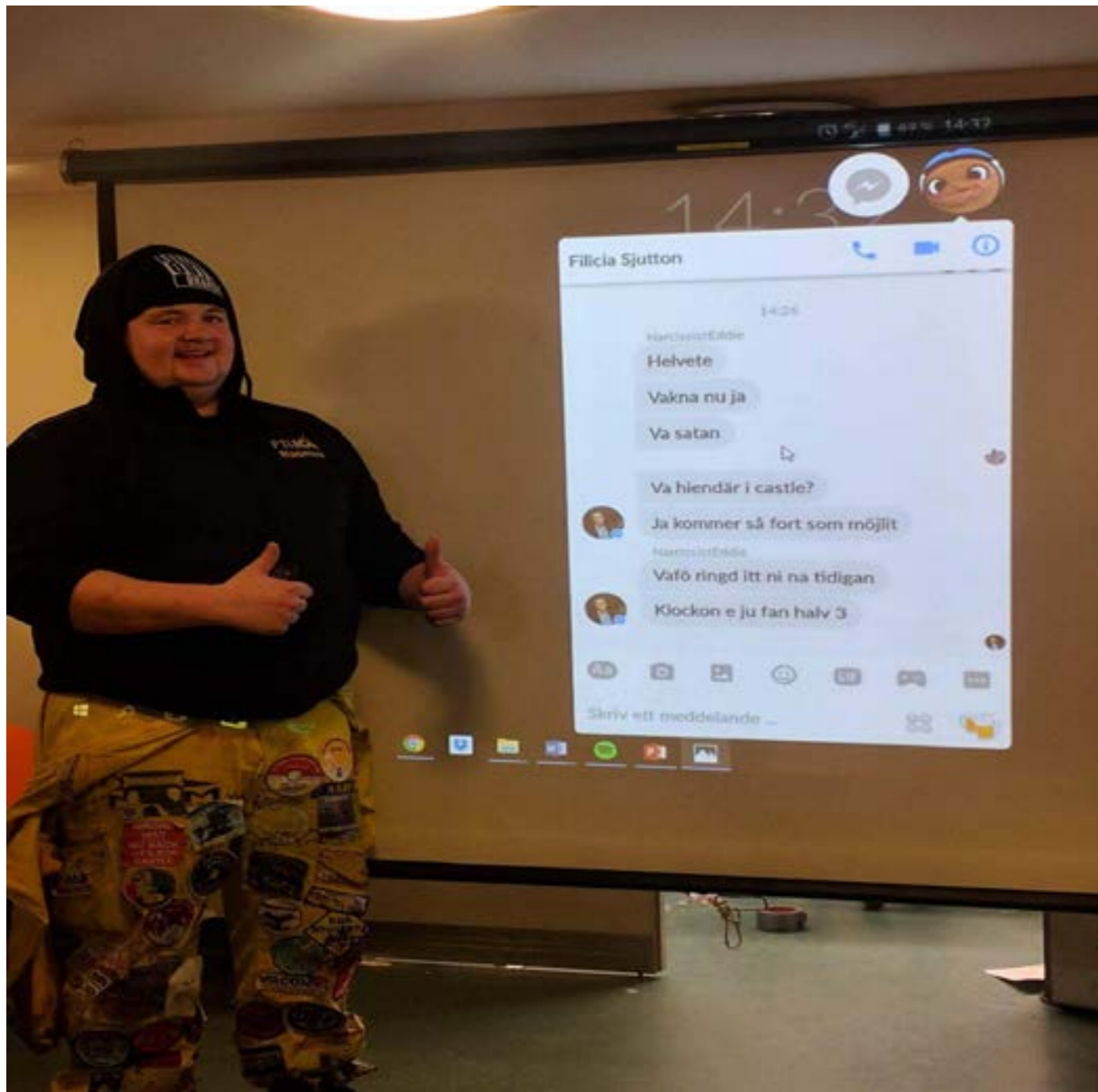
Årsfest Sillfrukost 14.30